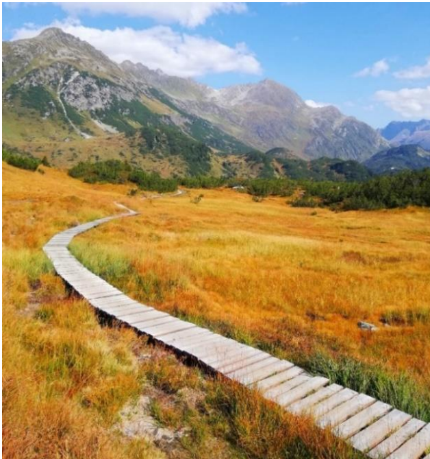
Berufswege sind selten so klar

Wenn man Menschen nach ihrem bisherigen Berufsweg fragt, hört man eher selten, dass jemand einen klaren Weg verfolgt hätte.