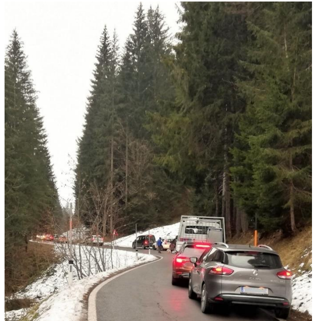
Corona verursacht auf so manchem Berufsweg einen Stau