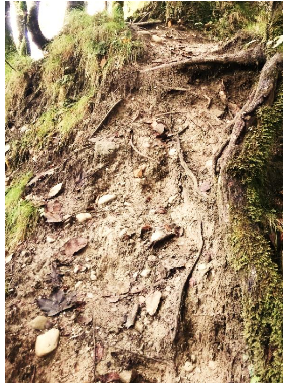
Ein Berufsweg kann auch unangenehme Passagen enthalten.

Einen Job recht unabhängig von der persönlichen Interessenslage ausüben. „Just for the money“ auf Grund der Notwendigkeit, den Lebensunterhalt selbstständig zu bestreiten.